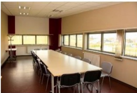
Salle réunion Authie