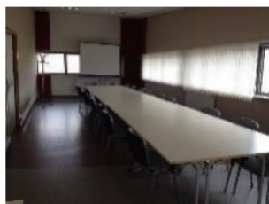
Salle de réunion Authie : 51 m 2 en R+1 (19 personnes maximum) 80 € HT la journée, 50 € HT la demi-journée

En fonction des disponibilités, possibilité de louer un bureau « de passage » équipé sur demande