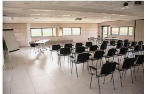
Salle séminaire Canche 1 & 2