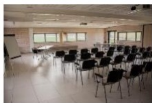
Salle Séminaire Canche 1 & 2 : 150 m 2 en rdc (150 personnes maximum) 200 € HT la journée, 150 € HT la demi-journée