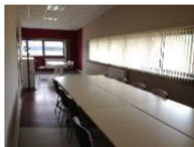
Salle de réunion Ternoise : 35,9 m 2 en R+1 (10 à 15 personnes maximum) 50 € HT la journée, 30 € HT la demi-journée